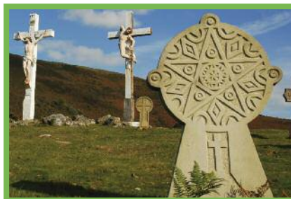
Stèles discoïdales de la chapelle de l'Aubépine

Cet art traditionnel basque fut supplanté par les caveaux en marbre et granit, érigés de croix. Aujourd'hui, dans les cimetières paysagers renaissent des stèles contemporaines.